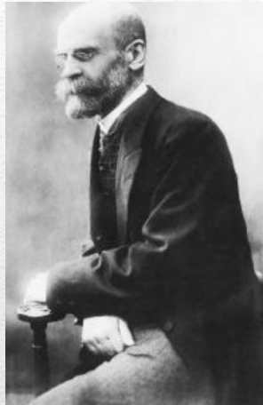
Emile Durkheim (1858-1917) e l'oggettivismo sociologico